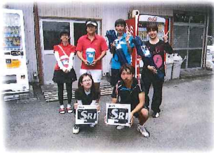
前列:優勝ペア 後列右から準優勝ペア、3位ペア