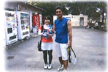
コンソレ優勝ペア