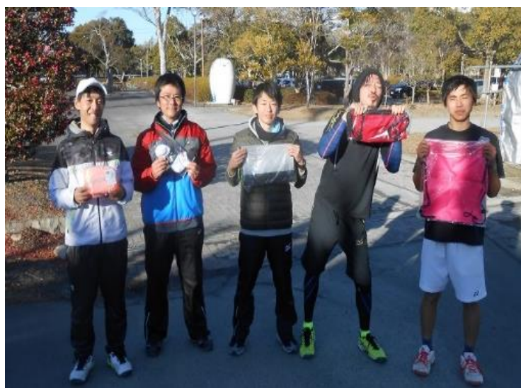
左から、本戦3位・本戦3位・コンソレ優勝・本戦2位・本戦優勝