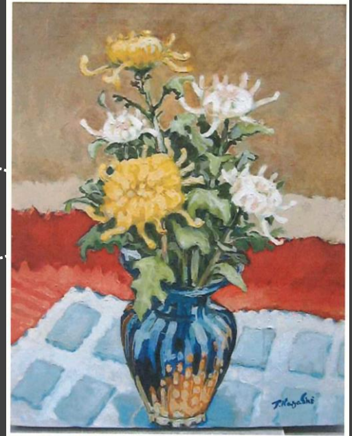
写真はイメージです。