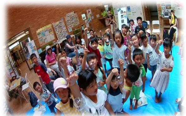
【〇×ゲームで浜名湖を学ぼう】