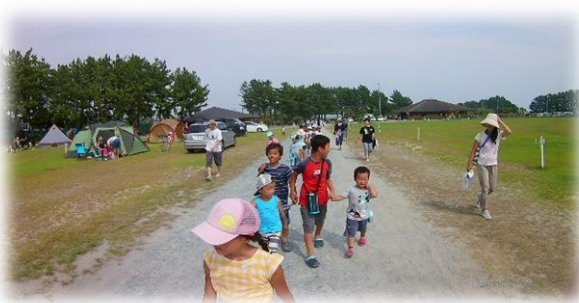
【浜名湖で海の生き物を触ろう!】