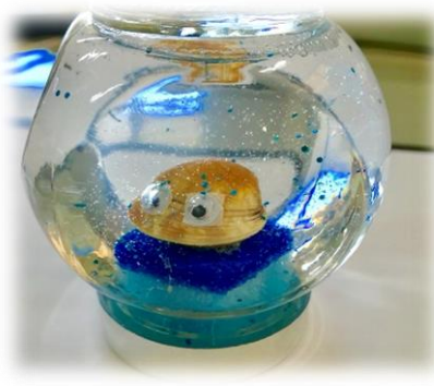
【スノードームを作ろう】